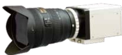
サンプリングモアレカメラ DSMC-100A