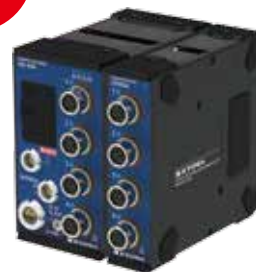
コンパクトレコーダ CTRS-100シリーズ

2020年 2月26日(水)~28日(金) 10:00 ~ 18:00 (最終日のみ17:00)