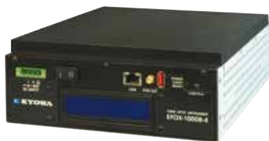
光ファイバ測定器 EFOX-1000B-4