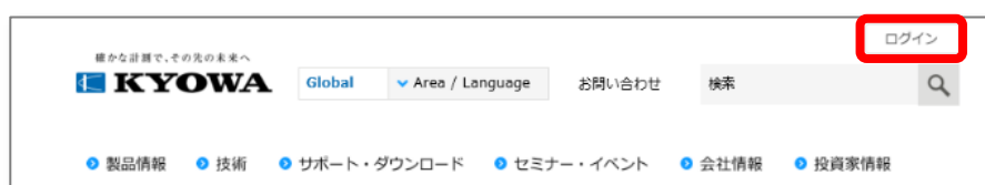
図 1 マイページのログインボタン