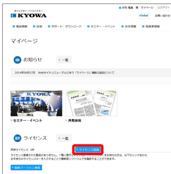
図 2-1 マイページ内のライセンス登録ボタン

もしくはソフトウェア製品のラベルに印字されている URL にアクセスするか、二次元コードを 読取り (図 2-2)、「インストールするために」にある ライセンス登録 ボタンをクリックします。